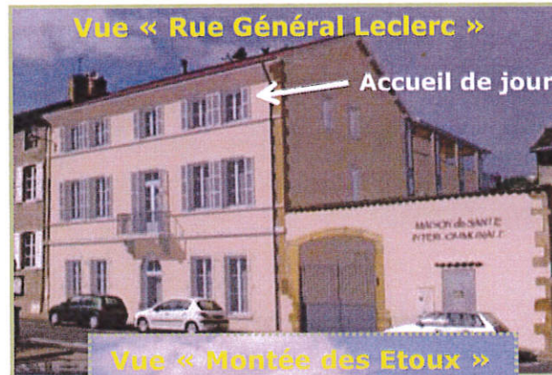
Vue « Montée des Etoux »

Il propose des activités variées afin de maintenir l'autonomie des personnes accueillies.